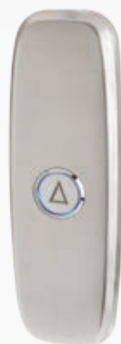
BUG#01V000_L BUG#01V000_S Con scasso 1 pulsante in acciaio lucido (L), in scotch brite (S) / With hole 1 button in mirror (L), in scotch brite (S).