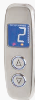
BUG#02VDI1W_L BUG#02VDI1W_S Con scasso display Icaro + scasso 2 pulsanti in acciaio lucido (L), in scotch brite (S) / With hole for Icaro LCD and 2 buttons in mirror (L), in scotch brite (S).