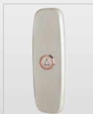
Madreperla Pearl colour