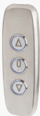
BUG#03V000_L BUG#03V000_S Con scasso 3 pulsanti in acciaio lucido (L), in scotch brite (S) / With hole 3 buttons in mirror (L), in scotch brite (S).