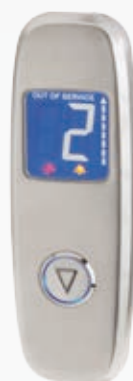
BUG#01VDI1W_L BUG#01VDI1W_S Con scasso display Icaro + scasso 1 pulsante in acciaio lucido (L), in scotch brite (S) / With hole for Icaro LCD and 1 button in mirror (L), in scotch brite (S).