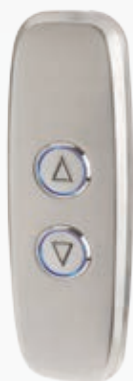
BUG#02V000_L BUG#02V000_S Con scasso 2 pulsanti in acciaio lucido (L), in scotch brite (S) / With hole 2 buttons in mirror (L), in scotch brite (S).